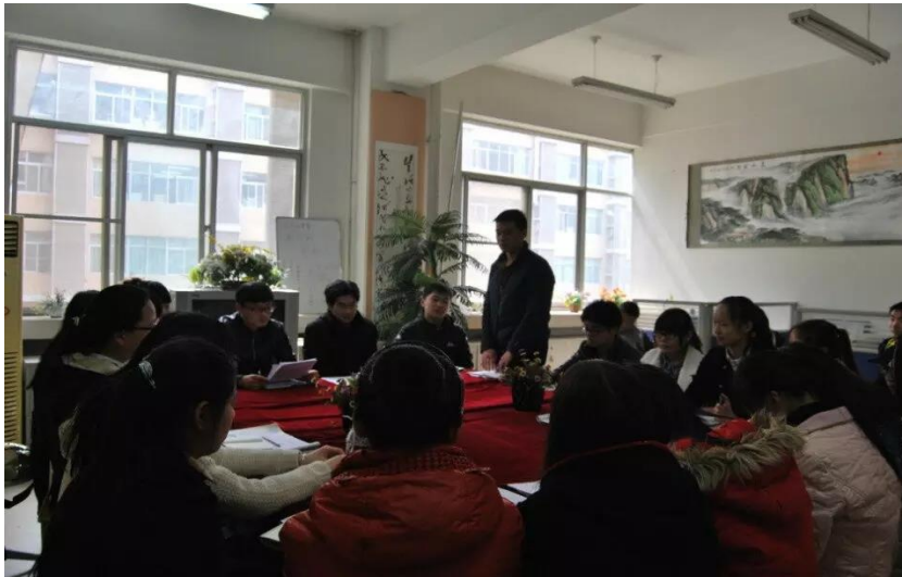
两学一做，争做优秀共产党员

我院积极响应上级党组织号召，启动了“两学一做”学习教育，引导学生、干部以学促做，进一步增强责任感和使命感，为学校、学院事业持续健康发展提供精神动力和智力支撑。开展“两学一做”学习教育是加强党的思想政治建设的一项重大部署，是推动全面从严治党向基层延伸的有力抓手，是推动党内教育常态化制度化的重要实践。