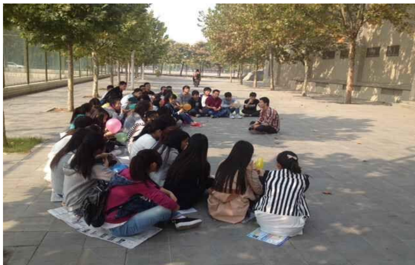
“安全警钟常鸣”主题班会

为同学安全负责，及时检查、消除安全隐患，教育大家牢固树立安全意识，增强自防、自护、自救的能力，从而保证日常工作健康有序进行。通过开展以“安全警钟常鸣”为主题的安全知识教育班会，增强班内学生的安全意识，懂得使用一些基本的校内外安全知识，达到积极预防事故的发生并提高同学基本自我保护的能力。