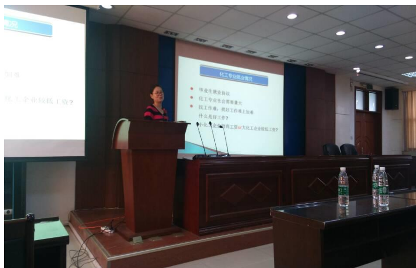
班主任在给大家传授经验

明确的学习目标可以为学生确定明确的努力方向！为了解决同学进入大学后学习的盲目性，我班邀请专业班主任为学生分析培养计划，指明前进目标，指导大家选择适合本专业的辅助课程，激发学生学习的兴趣，促进我班班级学风的建设。