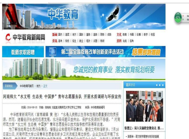
暑期实践团队被中华教育网报道