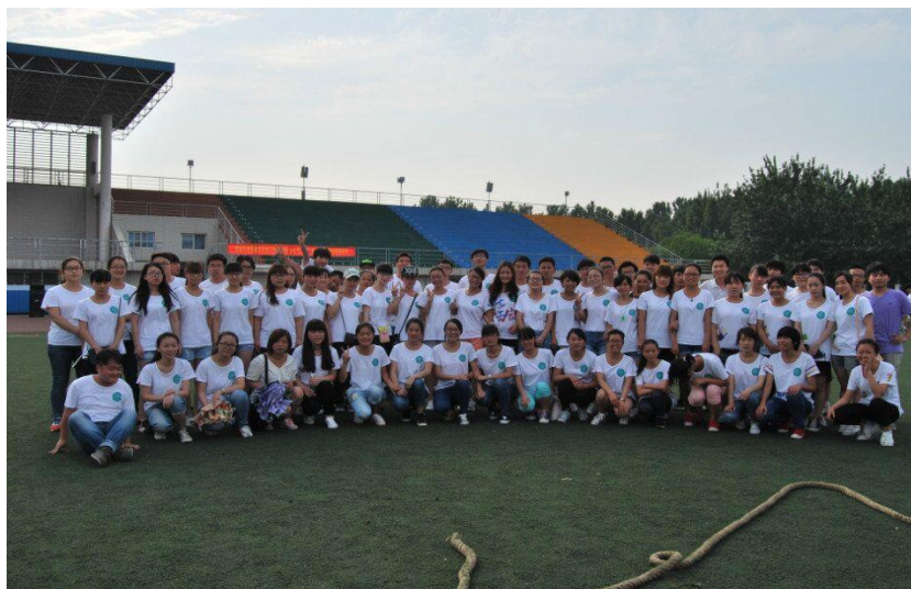
团结奋进的化工一班