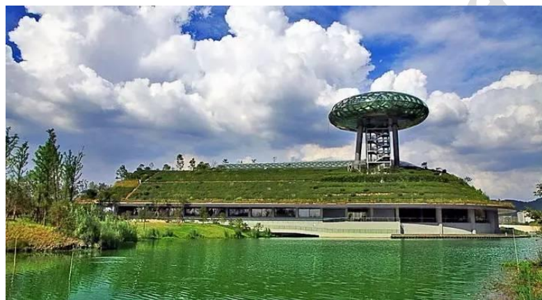
图 2 中国湿地博物馆